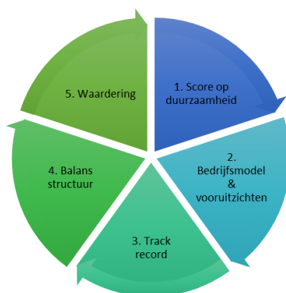
Afbeelding 2: 'De schijf van vijf'©

Graag lichten wij ons beleggingsproces mondeling toe.